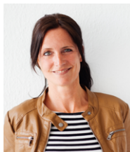
Gründungsberatung Business Coach