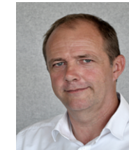
Geschäftsführer Managing Director