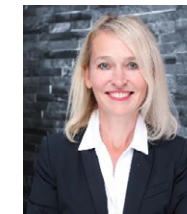
Nachfolgecoach Wirtschafts- förderung Schwalm-Eder-Kreis Business Succession Coach