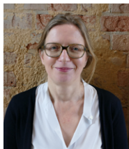
Gründungsberatung Business Coach