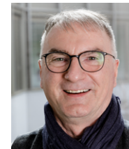
Geschäftsführer Managing Director