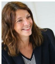
Betriebsübergabecoach Business Takeover Coach