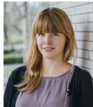
Gründungsberatung Business Coach