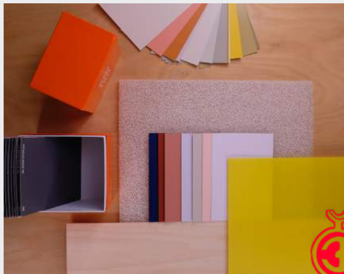
Das neue RAL Sytsem plus © RAL Farben