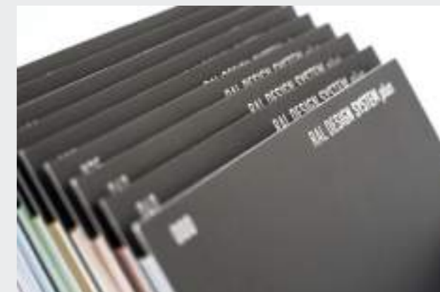
Das neue RAL Sytsem plus

Das RAL Starter-Kit ist ein Entwurfstool für Farbdesignaufgaben. Es bietet eine abgestimmte Auswahl an Farbkarten im Format DIN A6 für professionelle Raum- und Produktgestaltung. Die Wahl der Farbtöne erfolgte unter Berücksichtigung aktueller Farbtendenzen und zeitloser Gestaltungsprinzipien (Kontraste, Farbsequenzen, Systematik). Durch die reduzierte Komplexität des Farbtonumfangs eignet sich das Paket besonders als schnelles Arbeitstool im Studium, bei der Bemusterung, für Moodboards und Farb-Material-Collagen. Es lassen sich leicht Farbstimmungen eines Raumes oder Objektes zwischen sehr hellen Farbtönen und stark gesättigter Farbigkeit eingrenzen und bestimmen. Das Tool wurde an der HAWK von Prof. Dipl.-Des. Timo Rieke und Prof. Ing. Markus Schlegel aus der Praxis heraus entwickelt und ist Teil der Muster-Box, die dem 1. und 2. Semester zur Verfügung gestellt werden konnte.